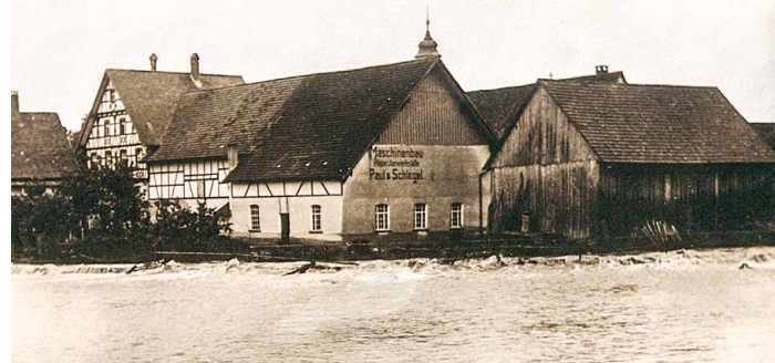
Ursprung der Paul Maschinenfabrik im Zentrum von Dürmentingen.

Ergänzende Details und spannende Hintergründe erfahren Sie auf unserem Rundgang bequem per Audioguide mit dem eigenen Smartphone. Eine App-Installation (QR-Code-Scanner und Webbrowser vorausgesetzt) ist nicht erforderlich und die Anmeldung lediglich im Gast-WLAN von Paul notwendig. Für ein besseres Hörerlebnis empfehlen wir, Kopfhörer für das Smartphone mitzubringen.