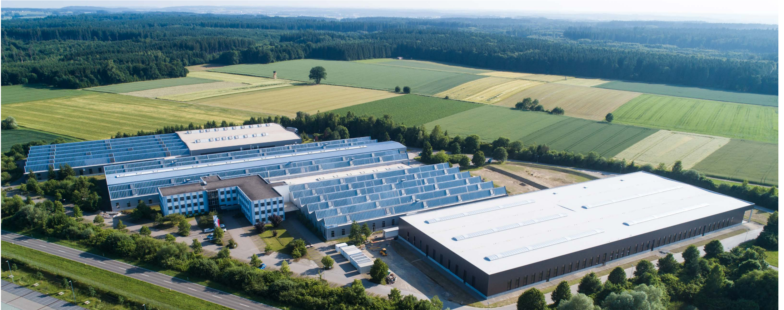
Die Paul Maschinenfabrik hat ihre Produktionsstätte erweitert (Halle rechts) und setzt damit ein klares Zeichen für den Standort Dürmentingen.