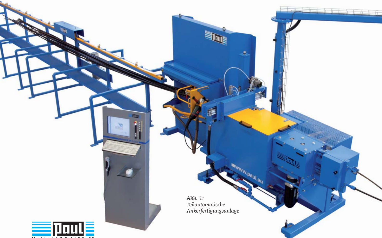
Abb. 1: Teilautomatische Ankerfertigungsanlage