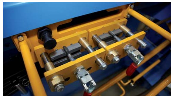
Abb. 3: Klemmvorrichtung zum Festklemmen des PE-Rohrs